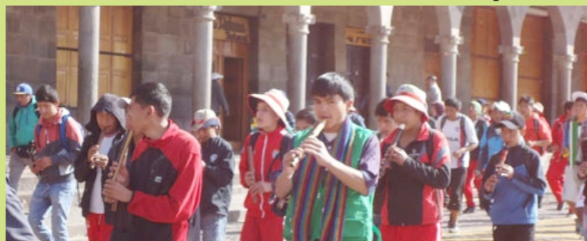
“Amigo y amiga, no digas No, sin antes haberlo intentado(...)”.

Por ejemplo, mi participación en la AARLE Fajardo me ha permitido adquirir experiencia,